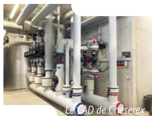
Le CAD de Chésereux

question du chauffage car les convecteurs électriques n'étaient plus autorisés. La solution retenue fut de prolonger le réseau CAD communal en installant de nouvelles conduites, permettant dans le même temps, de raccorder l'Administration communale, une construction prévue sur la parcelle communale 33, l'auberge « Les Platanes », ainsi que le bâtiment multifonctions récemment achevé.