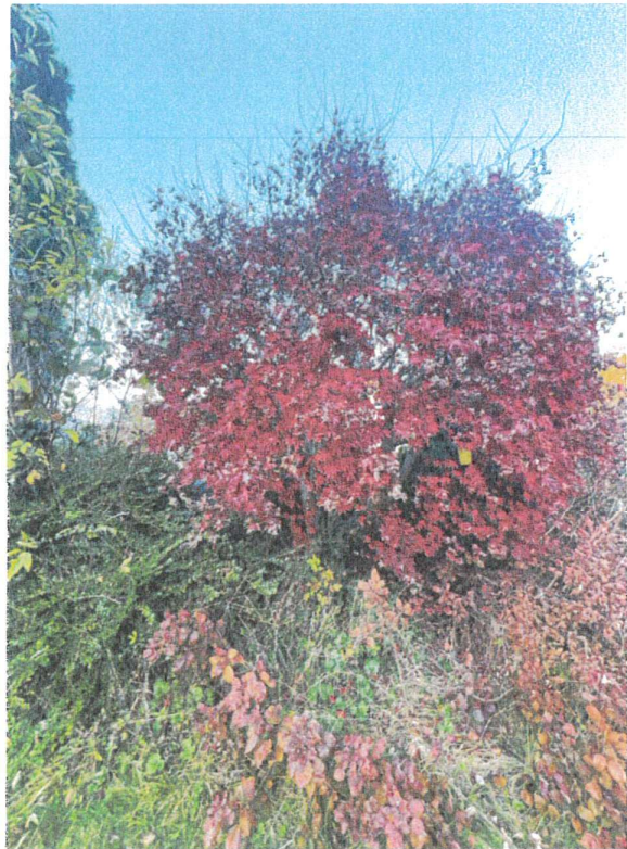
Erable du Japon